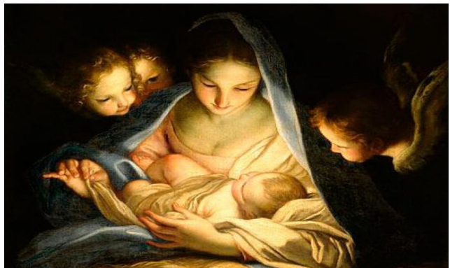
'Heilige Nacht' van Carlo Maratta (1625-1713)

Als een woord dat, eens gegeven, nóg de morgen ontbiedt, zegt Gij ons aan de nacht niet meer te vrezen, want uw ster verlaat ons niet.