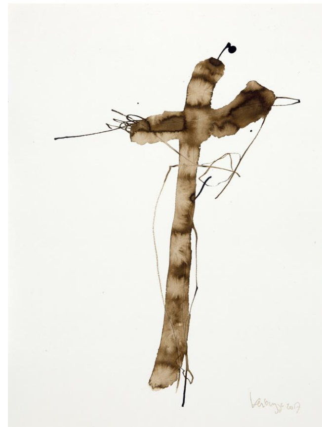
Tekening: Marcel Verbrugge

De Veertigdagentijd is een periode van bezinning en rust. Gedurende de Stille Week zullen wij in de Nieuwe Badkapel te midden van alle hectiek van het dagelijks leven momenten van rust en bezinning creëren